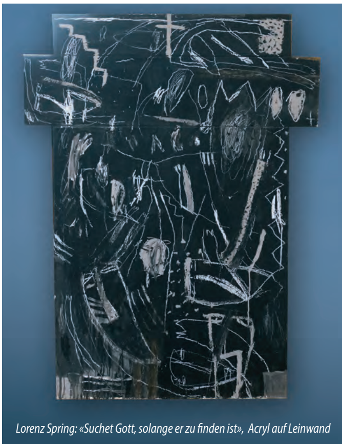
Lorenz Spring: «Suchet Gott, solange er zu finden ist», Acryl auf Leinwand